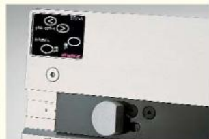
Butée de papier avec cellule qui déclenche l'opération de perforation