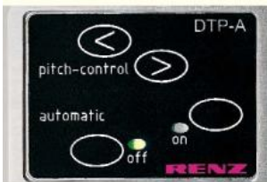
Tableau de commande clair pour réglage de tous les paramètres.