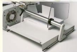
Panier de réception pour le papier perforé

PERFORATION SEMI-AUTOMATIQUE Grâce à la conception du système semi-automatique réalisé par la société RENZ, une toute nouvelle catégorie de machine a été développée. Ainsi pour la première fois, il a été possible de proposer une machine qui répond aux exigences des utilisateurs: rapidité, flexibilité, rentabilité et simplicité au niveau du maniement.