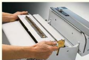
Changement d'outil rapide et sans difficulté en quelques minutes